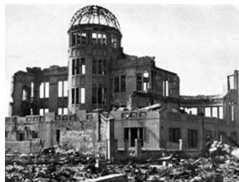
Musée des Sciences et Techniques d'Hiroshima le 6 août 1945

Sincèrement, je n'aimerais pas être à la place des matérialistes aujourd'hui. Car c'est la science, et elle seule - elle qui devait être leur meilleur et plus fidèle allié dans la lutte contre toute forme de spiritualisme - qui a dévasté comme une tornade le paysage du matérialisme. Tous ses fondements se sont écroulés... à l'exception du darwinisme. (...) Il n'existe pour l'instant ni test ni expérience permettant de réfuter véritablement le darwinisme (...) et non l'évolution qui est un fait scientifique incontestable.